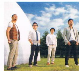
〔賛美ゲスト〕 ナイトdeライト

〔問い合わせ〕イムマヌエル綜合伝道団(本部) TEL: 03-3291-1308