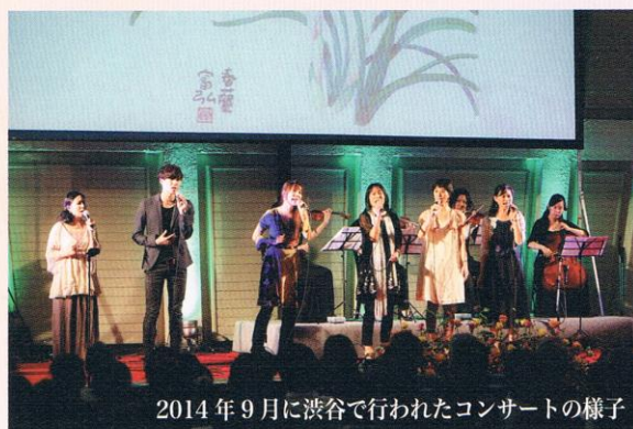
2014 年 9 月に渋谷で行われたコンサートの様子