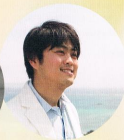
Rainbow Music Japan